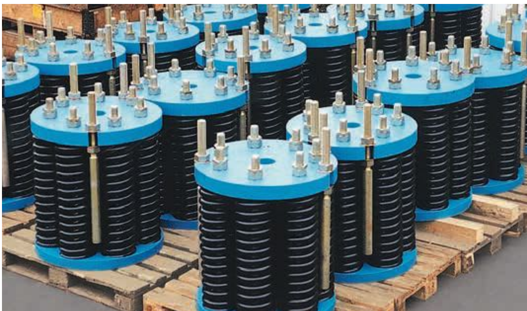
Специальные пружинные подвески для использования на котлах электростанций

① Размеры B и X уменьшаются под нагрузкой на соответствующий ход пружины (см. таблицу нагрузок на стр. 2.6).