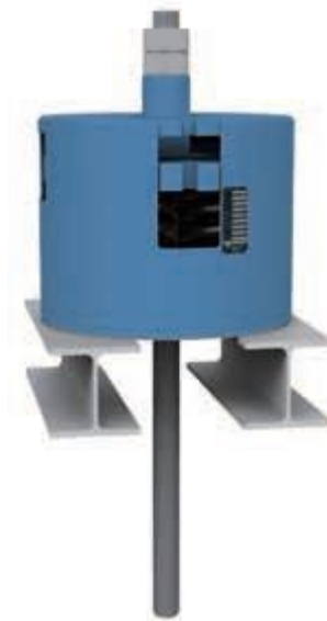
Пружинная подвеска посадочная, типы с 26 11 19 до 26 53 19